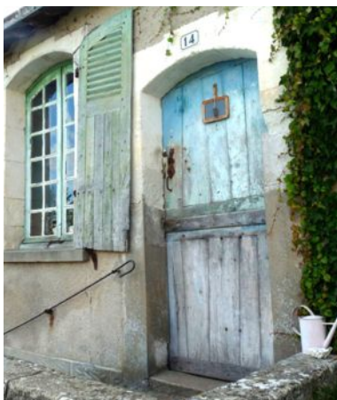
Une charmante et modeste façade (sans ciment ce serait encore mieux...)