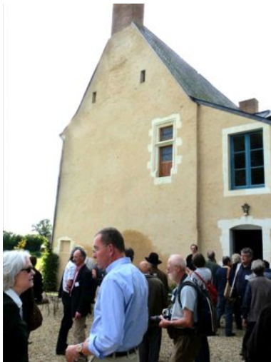
Une restauration qui a soulevé bien des commentaires...

Le Lude (Sarthe) 4, 5, et 6 octobre 2013