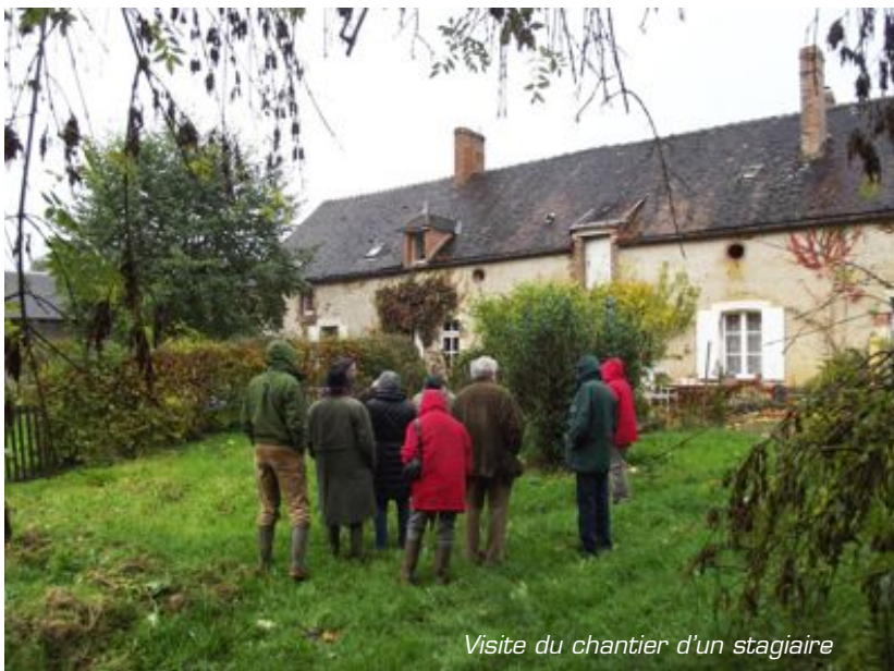
Visite du chantier d'un stagiaire

✓ La législation et son évolution de la RT 2005 à la RT 2012 : si cette dernière s'avère très exigeante pour le neuf quant aux performances thermiques, (la demande de permis de construire devant annoncer des objectifs qui seront contrôlés à la fin des travaux), le bâti ancien (d'avant 1948) relève d'un arrêté du 3 mai 2007 qui exclut des travaux modifiant l'enveloppe extérieure des bâtiments inscrits ou classés et ceux qui se trouvent dans le périmètre protégé de ces bâtiments. Les travaux visant aux économies d'énergie ne sont alors pas l'objet d'un contrôle. En revanche les extensions de plus de 40 m 2 relèvent de la RT 2012.