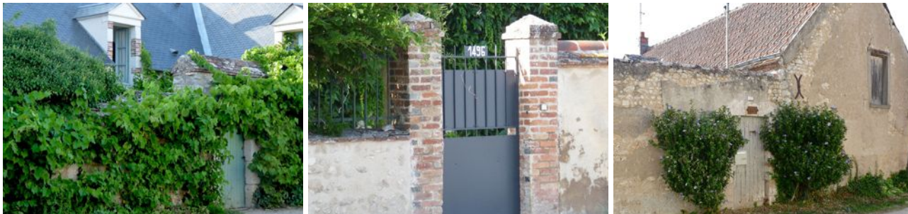
Ci-dessus : Les végétaux ajoutent au charme de ces portillons.

Quelques murs de clôture des propriétés, outre le portail, comportent un portillon pour les piétons ; celui-ci est en général traité de la même façon que le portail (même type de piliers).