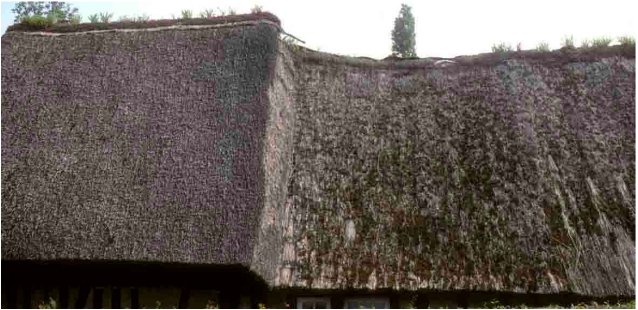
Combon (Eure), 1994, la différence d'aspect entre le roseau, à gauche, et le seigle, à droite, saute aux yeux. Le roseau fait plus policé, le seigle, plus rustique.