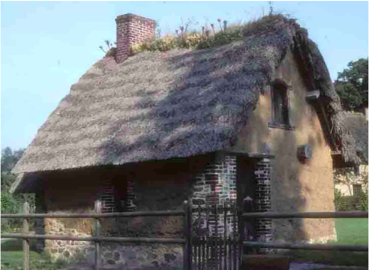
Le four à pain