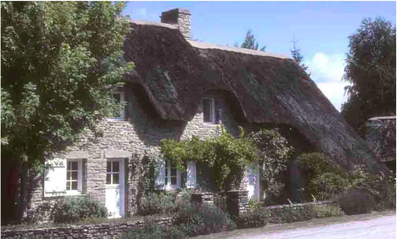
Kerhauguet (Loire-Atlantique), 2005. photo du haut et photo du bas.