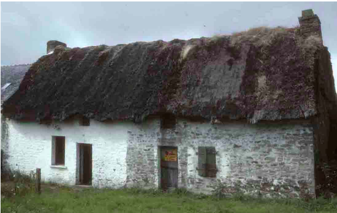
Saint-Lyphard (Loire-Atlantique), 1988, chaumière à deux logis.