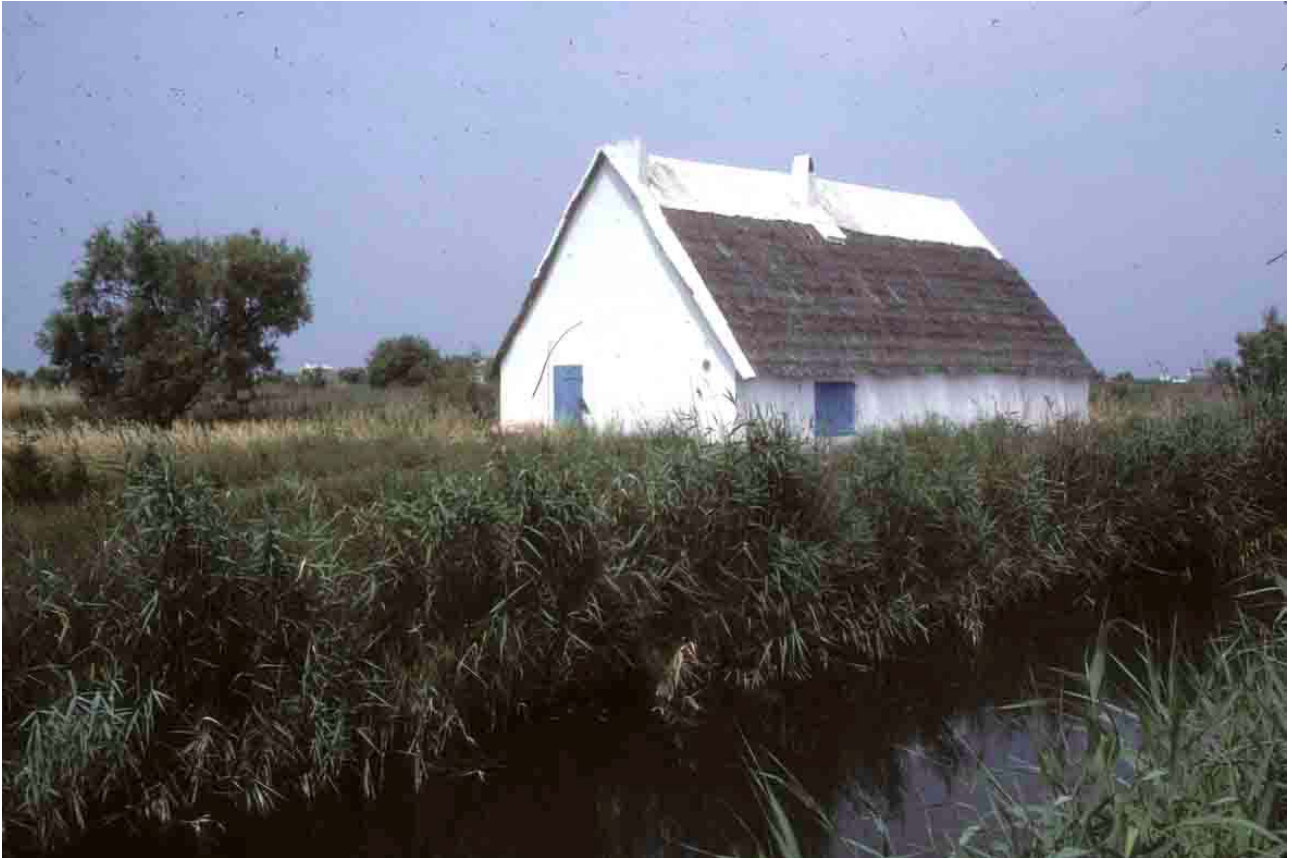
Environ des Saintes-Marie-de-la-Mer (Bouches-du-Rhône), 1987, maison de pêcheur.