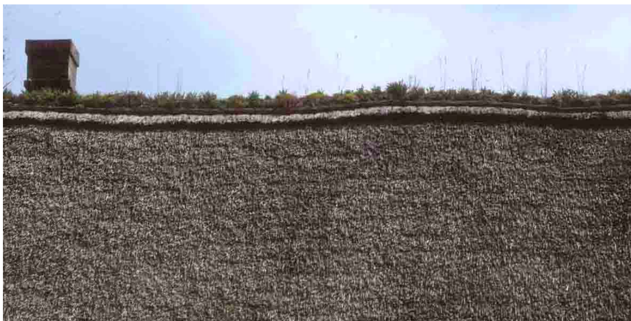
Claville (Eure), 1994.

En Camargue, les manons, ébarbés de leurs têtes, sont posés à l'envers et renforcés par une seconde couture. Ils sont recouverts par la cape, faîtière constituée d'un mortier de chaux blanchi à la chaux. Le revêtement de l'abside subit un décrochement par rapport à celui du faîtage et les manons sont obligatoirement plus serrés.