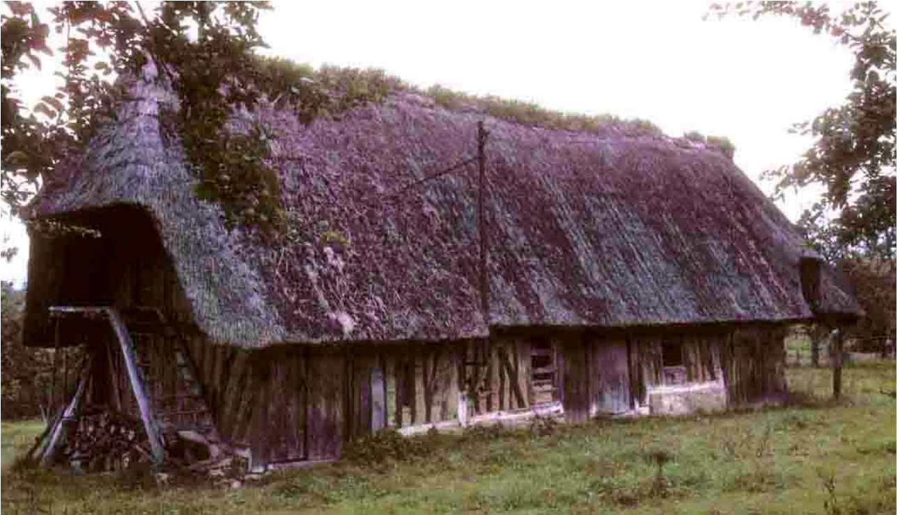
Le Marais-Vernier (Eure), 1988, deux étables, celle du dessus possède un escalier de montée au grenier protégée par une « aile de geai ».

Bray 1988 Env Brestot 1988 Env Cauverville 1988 Ferrière-Haut-Clocher Le Bas-de-Derrière 1988 Le Marais-Vernier 1988 Saint-Samson 1988 Saint-Sulpice 1988