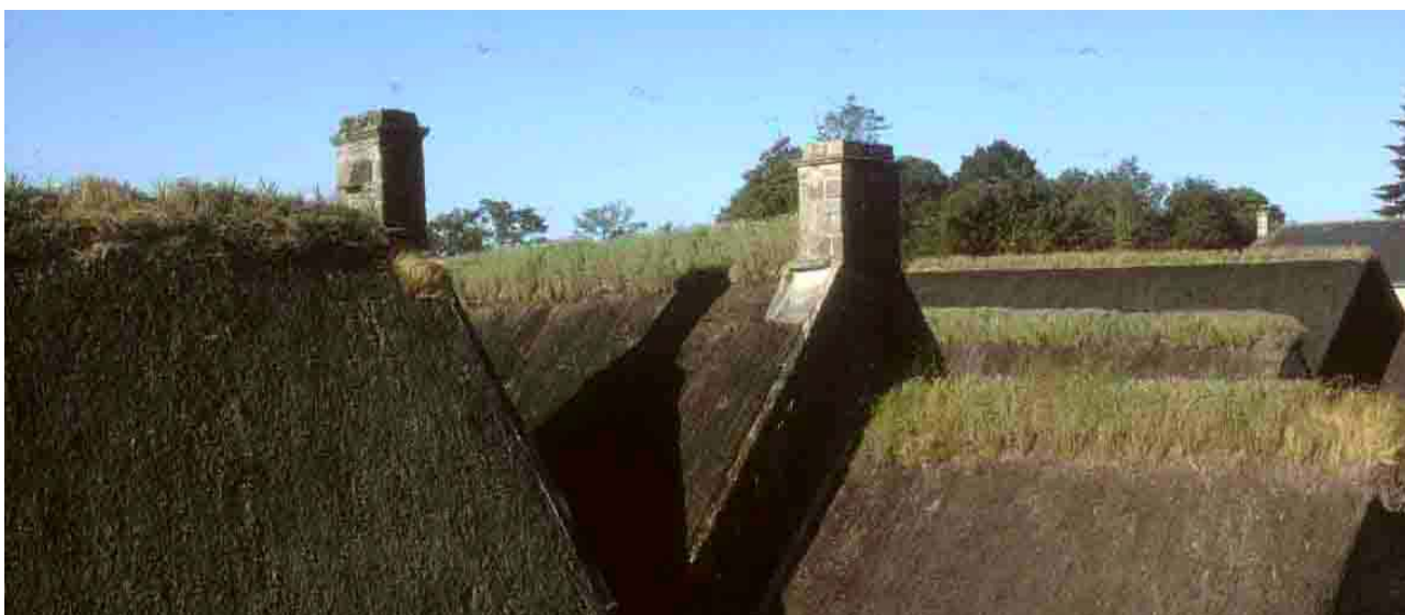
Les toits de Poul-Fétan (Morbihan), 1994.

Il faut de 8 à 10 gerbes, soit une cinquantaine de manons au mètre carré, et un total de 4 500 manons pour une cabane de dimensions moyennes. Deux semaines de travail et deux hommes sont nécessaires pour la couverture d'une maison d'habitation de 10 mètres de longueur, ce qui revient à la pose de 200 manons par jour et par personne.