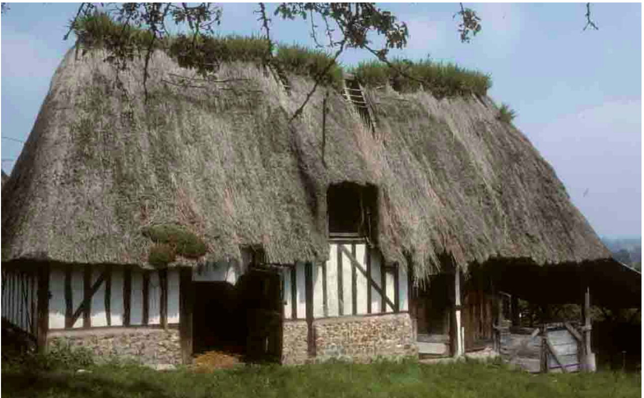
Maison du Marais-Vernier (Eure), 1994. La Normandie chevelue.

Dans la revue qui suit, nous indiquons, pour chaque lieu, l'année de première observation du chaume. La seconde date correspond à l'année à laquelle a pu être constatée la disparition de cette couverture. Cette statistique porte sur l'ensemble des couvertures de chaume d'un site et non couverture par couverture. Ainsi, la disparition doit être complète sur un même site pour être indiquée comme telle.