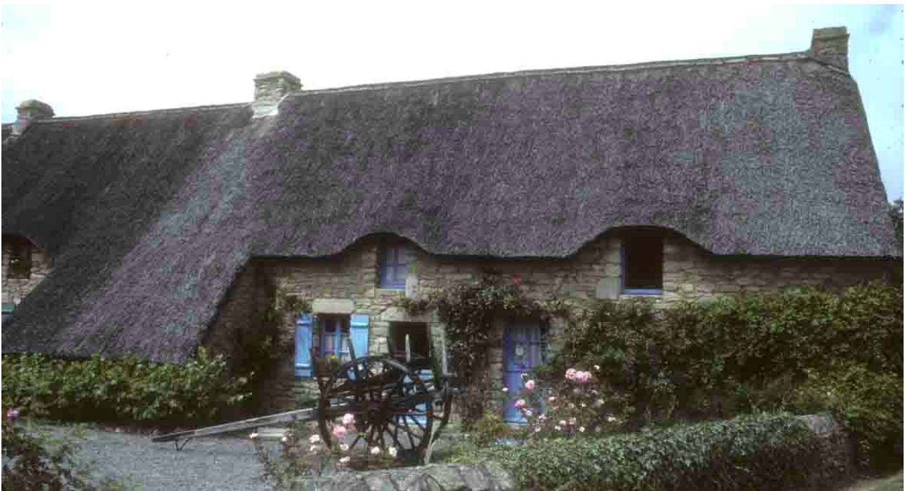
Khérintet (Loire-Atlantique), 1980, maison de l'écomusée.

En Loire-Atlantique, le Parc Régional de la Brière a poussé plus loin la réflexion sur l'emploi et le réemploi du chaume, à travers plusieurs réalisations de grande envergure, notamment à Khérintet et à l'île de Fédrun. Il faut dire que les conditions locales se prêtent bien à la maintenance d'un matériau encore abondant et gratuit. Le Parc de Brière n'a pas lésiné sur les efforts pour promouvoir le roseau en toiture, avec les deux « vitrines » créées dans les lieux précités, accompagnées d'un nombre important d'études sur l'habitat traditionnel. Son action n'a pas été sans effets sur la sensibilisation de la population locale.