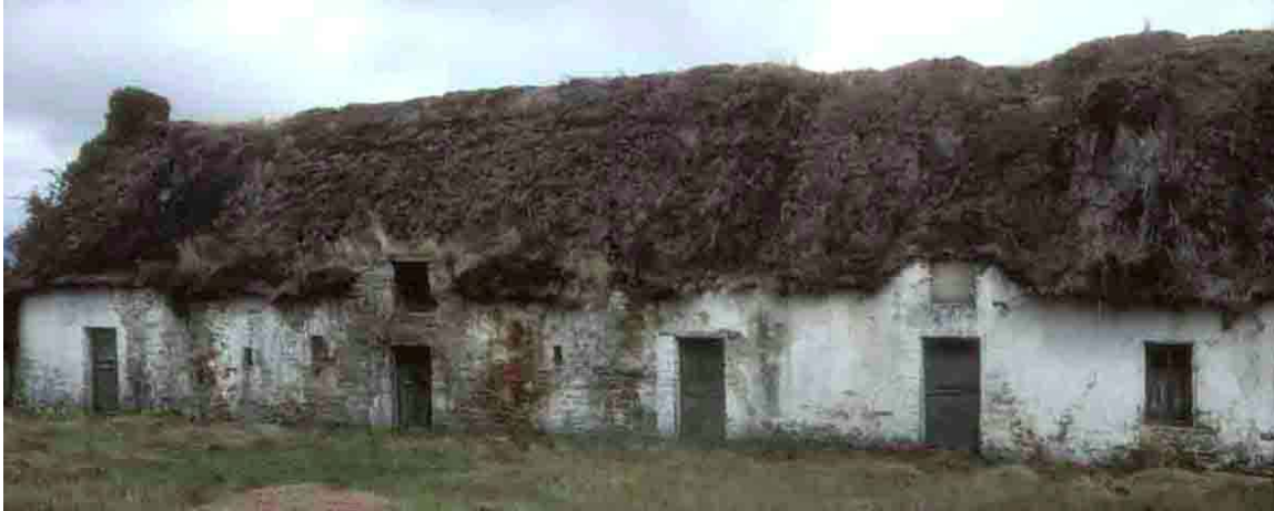
Marlais (Loire-Atlantique), 1988, un chaume assez ébouriffé.