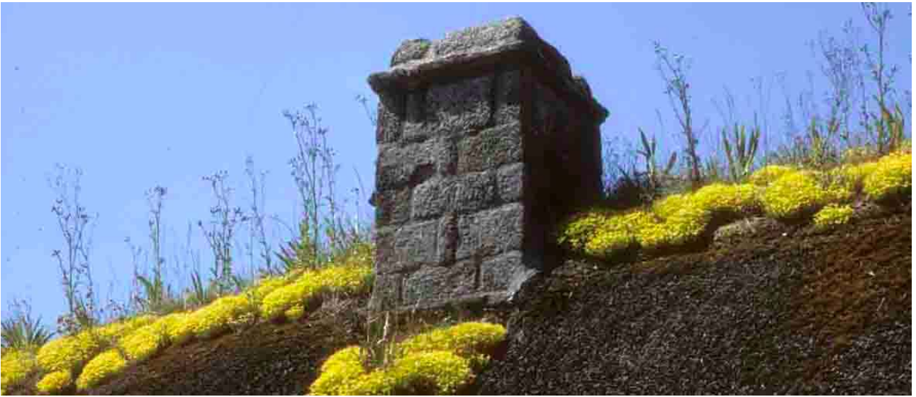
Poul-Fétan (Morbihan), 1994, de la joubarbe notamment, mais elle est rapportée.