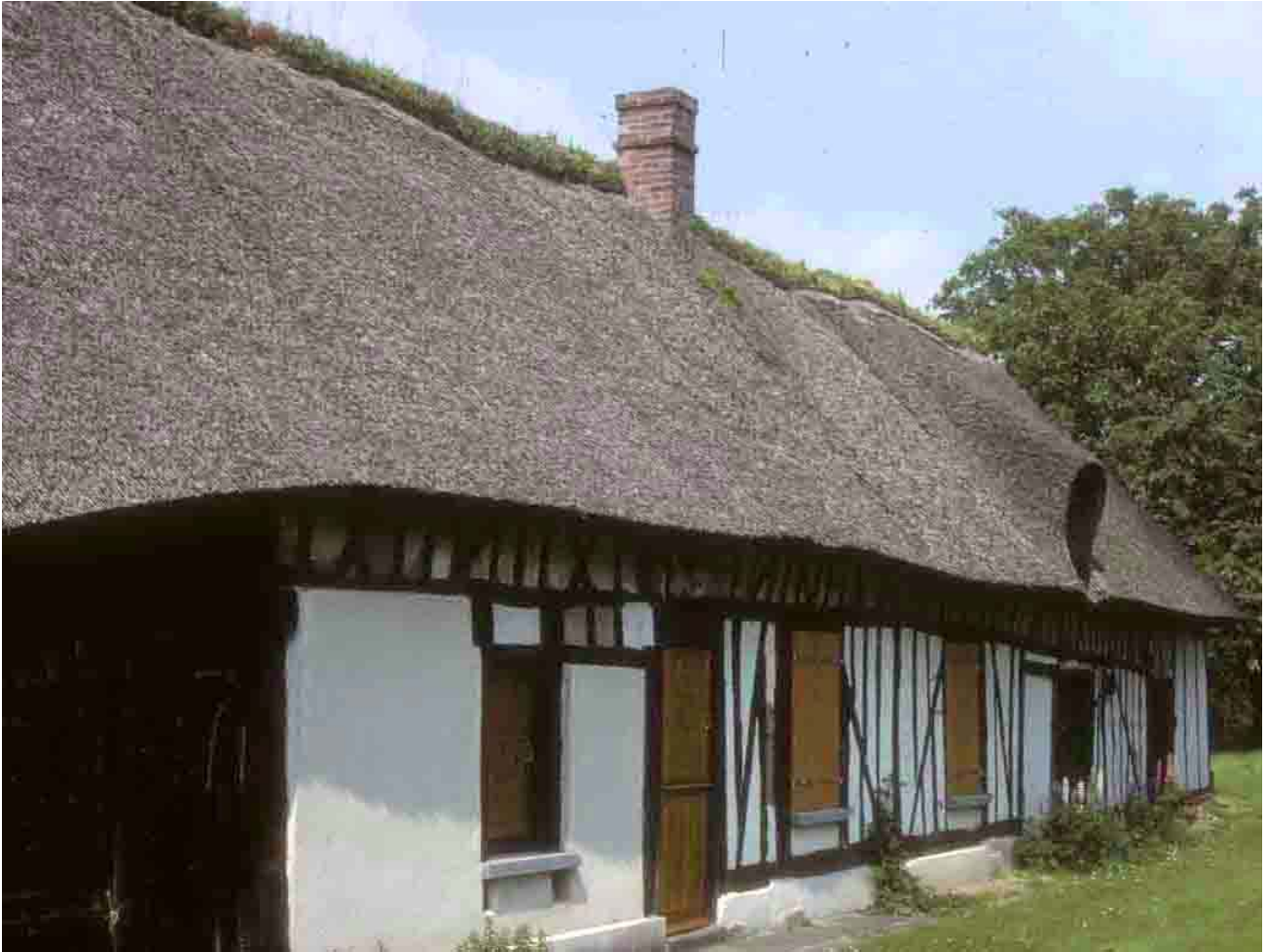
Claville (Eure), 1994, réalisation moderne en roseau.