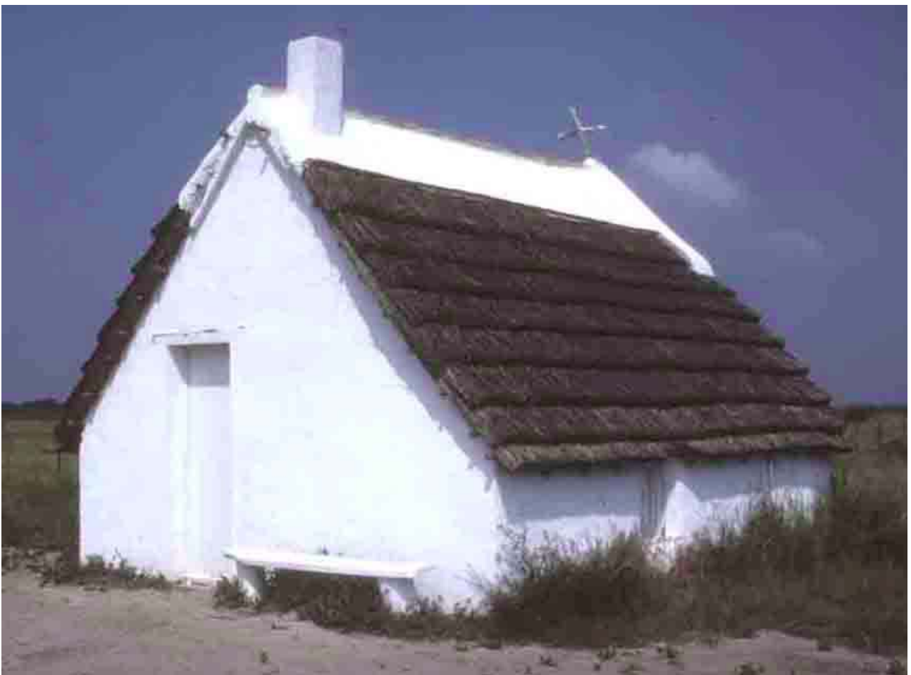
Ecomusée du Mas du Pont de Rousty (Bouches-du-Rhône), 1987, maison de gardian.

En Camargue, les principales zones de récolte du roseau se situent sur les communes de Saint-Gilles et de Vauvert, dans le Gard; sur les communes des Saintes-Marie-de-la-Mer et d'Arles, dans les Bouches-du-Rhône. Le roseau est coupé en hiver, de début novembre jusqu'en avril, quand il est sec et défeuillé. En coupe manuelle, le sagneur saisit et coupe le roseau par poignées, le peigne à l'aide d'un sagnadou, le tape sur une planchette posée au fond de la barque, et le lie par paquets de 60 cm de circonférence environ. La coupe mécanique est pratiquée par les sagneurs professionnels avec un outillage adapté à partir de moissonneuses-lieuses à riz, ou de radeaux équipés de faucheuses-lieuses.