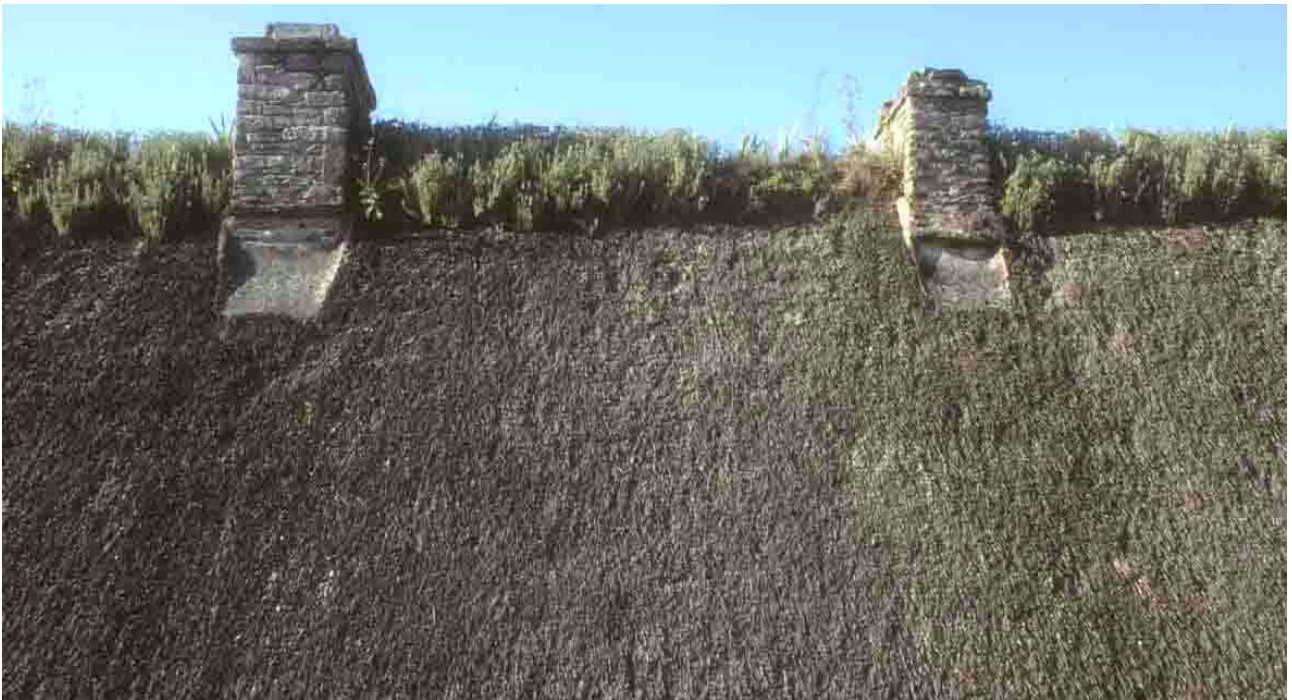
Poul-Fétan (Morbihan), 1994.