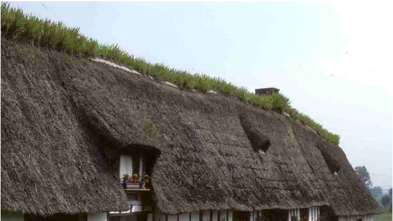
Le Marais Vernier (Eure), 1994.

A cause du vent marin, le chaume est maintenu par des perches sur tout le versant du toit. Pour la même raison, le toit de la bourrine est de pente faible, de l'ordre de 40°; et présente une forme ramassée comportant généralement une croupe à l'ouest.