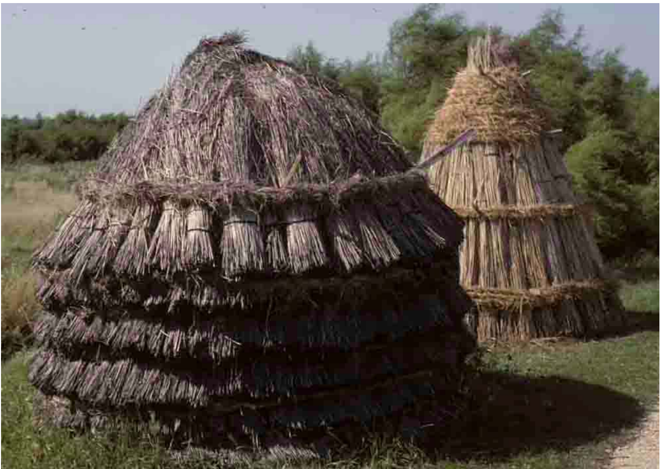
La Barre de Monts, écomusée du Daviaud, meules de gerbes de roseaux prêtes à l'emploi.,