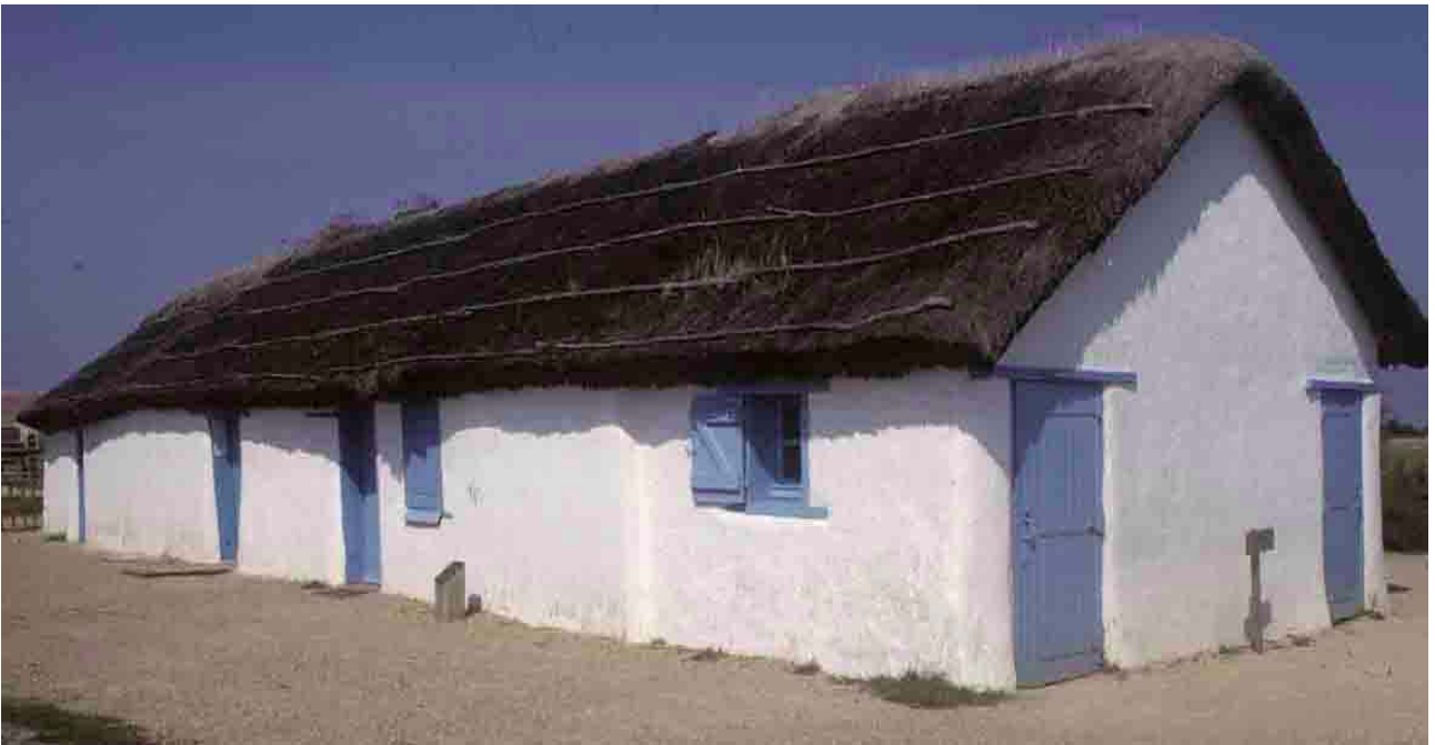
La Barre-de-Monts, l'écomusée du Daviaud (Vendée), 2001, bourrines en maçonnerie de terre et à toiture de roseaux.

En Vendée, si les réalisations conduites dans le cadre de l'écomusée de Saint-Jean-de-Monts illustrent assez bien la réussite de la restauration de plusieurs bourrines, elles ne provoquent guère d'émulation auprès des propriétaires du patrimoine local, malgré l'activité de deux artisans capables de perpétuer les traditions locales. On ne compterait plus de ce fait, qu'une cinquantaine de bourrines conservées, dans tout le marais vendéen.