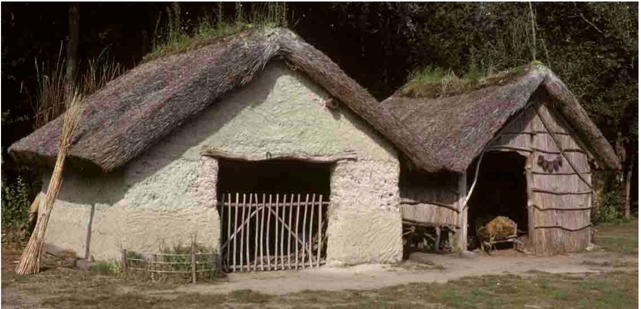
La Barre de Monts, écomusée du Daviaud, hangars construits de terre.