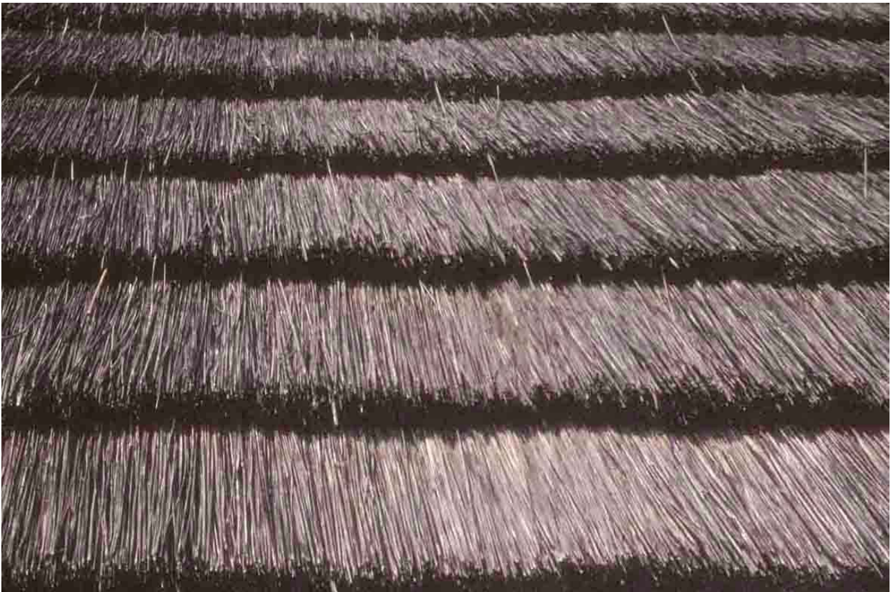
Couverture en gradins