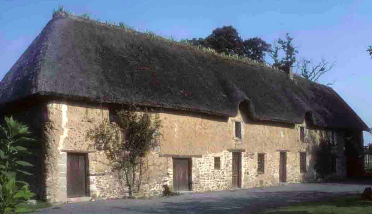
A Marchésieux (Manche), 2002, la maison de l'ADAME des Marais (la dame des Marais), construite en masse, a été convertie en écomusée, sous un toit de roseau.

Dans le Cotentin et le Bessin, les quelques 25 000 ha de marais recèlent 3 500 maisons en masse, ce qui justifie les actions de formation par du Parc Naturel Régional du marais du Cotentin et du Bessin et les aides de 20 % des travaux plafonnés à 150 000 f. Le matériau utilisé provient essentiellement de Camargue mais une opération de restauration de roselière est en cours pour relancer une production locale.