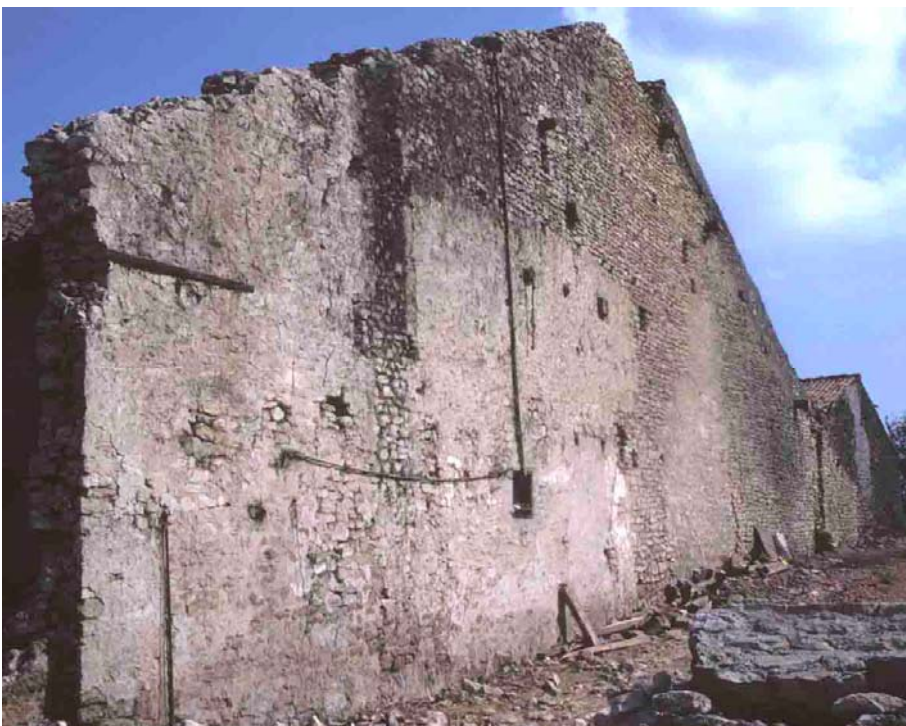
Bouvron (Meurthe-et-Moselle), 1987. La destruction d'une maison révèle le pignon dont elle avait la mitoyenneté avec sa voisine de droite. Il comporte des excavations dont le droit coutumier réglait la profondeur. En principe, chaque propriétaire possède la moitié du pignon.