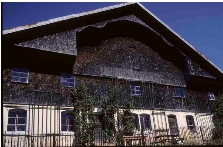
En Franche-Comté, avec des tavaillons. Villers-le-Lac sur la Roche (Doubs), 1979