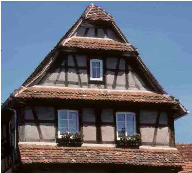
Comment se protéger de la pluie ? En Alsace, avec des auvents. Imbsheim (Bas-Rhin), 2004.