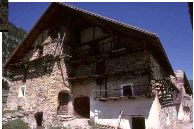
Dans les Alpes, en se retirant derrière le plan du pignon. Servières (Hautes-Alpes), 2000.