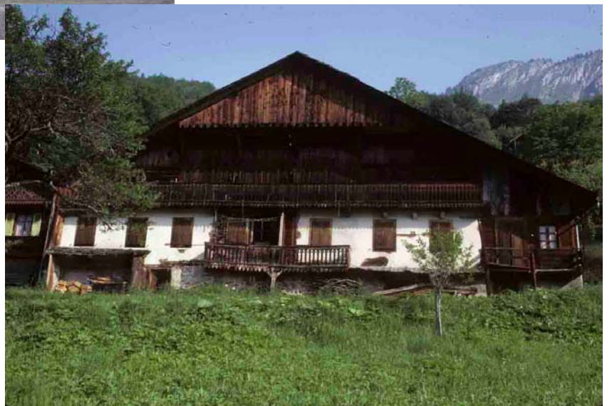
Richebourg (Haute-Savoie), 1987, grand chalet de la vallée d’Abondance, avec niveaux supérieurs en bardage.