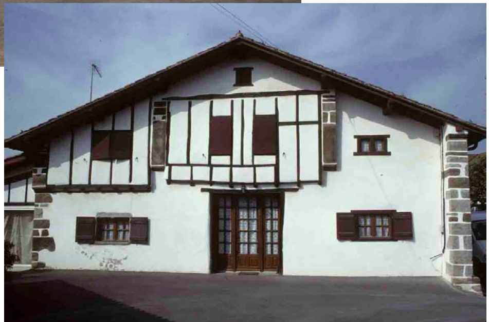
Armendaritz (Pyrénées-Atlantiques), 2001, comme la maison landaise, la maison basque s'organise dans l'axe des fermes de la charpente.

Le droit du pignon et mitoyenneté. Le droit coutumier de l'Ancien Régime pouvait traiter du partage juridique et pratique des pignons en cas de mitoyenneté des maisons, ce qui permettait à chacun des propriétaires – les comparsonniers – de connaître leurs droits et devoirs respectifs en matière de percements et d'exhaussements. Selon les coutumes, chaque propriétaire pouvait, par exemple, enfoncer ses poutres, ou ses jambages de cheminées, de la moitié ou des deux-tiers dans l'épaisseur du pignon. L'entretien ou la réparation du pignon pouvait être payé à frais communs. Le pignon tenait ainsi d'une double propriété – architecturale et juridique. Certaines coutumes évoquaient la présence de témoins dépassants, pour signifier que le pignon était des deux côtés la propriété de la même personne ; est-ce le sens qu'il faut donner à certains parpaings débordant en boutisses ?