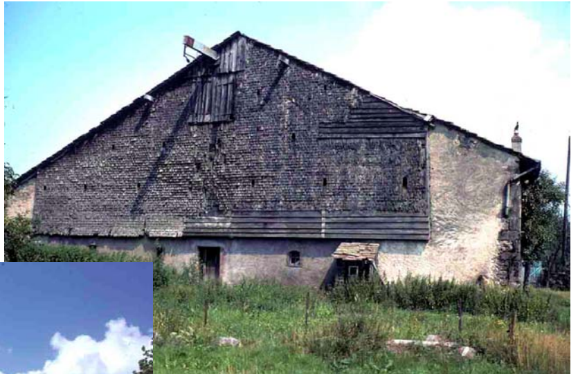
Environs de Remiremont (Vosges), 1976. pignon d’une maison des hautes Vosges, couvert d’une ramée de tavaillons.

Dans les montagnes et sur les hauts plateaux du nord-est de la France – Vosges et Jura – les maisons dites à pignon frontal concentrent l’essentiel de leurs ouvertures en pignon, lequel peut être de surface remarquable et se montrer particulièrement décoratif, comme pour les maisons à rang pendu du haut Doubs. Ces maisons restent essentiellement construites de pierre, contrairement aux chalets savoyards aux volumes plus réduits, à l’exception des grands chalets de la vallée d’Abondance. Les maisons à pignon frontal peuvent être conçues à double niveau, pour se conformer à la pente, et leurs façades se montrent généralement discrètes.