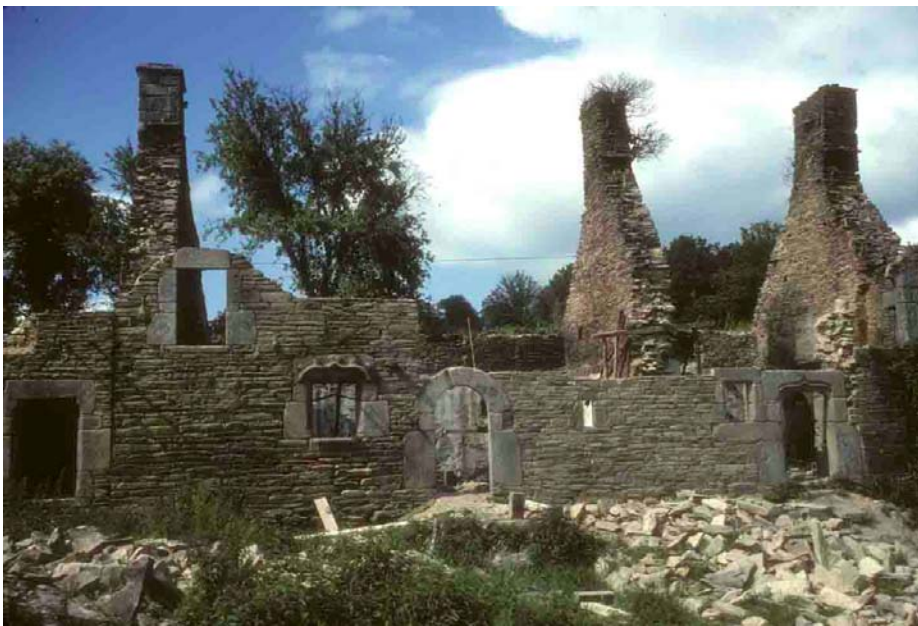
Poul-Fétan (Morbihan), 1979. La dépose de la toiture permet d'apprécier les rapports volumétriques entre les façades et les pignons.

Le pignon donne son volume à la maison, il s'ajuste au toit dont il épouse la pente, depuis la faîtière jusqu'aux égouts, à moins que ce ne soit l'inverse : c'est le toit qui accueille la forme du pignon. Du moins, les deux ont-ils une pente solidaire à celle de l'autre. Par nécessité, puisqu'il se prolonge jusqu'au faîtage, le pignon s'élève beaucoup plus haut que la façade qui ne dépasse pas l'égout. En principe, il ne reçoit pas les pluies recueillies par la toiture, à moins qu'elles ne débordent de la rive. Il existe toutefois, en Alsace, en Normandie, en Picardie .... des dispositifs de protection des pignons contre les eaux qui les battent directement mais, le plus souvent, il est rare que la rive (oblique) de la toiture, déborde largement sur le pignon.