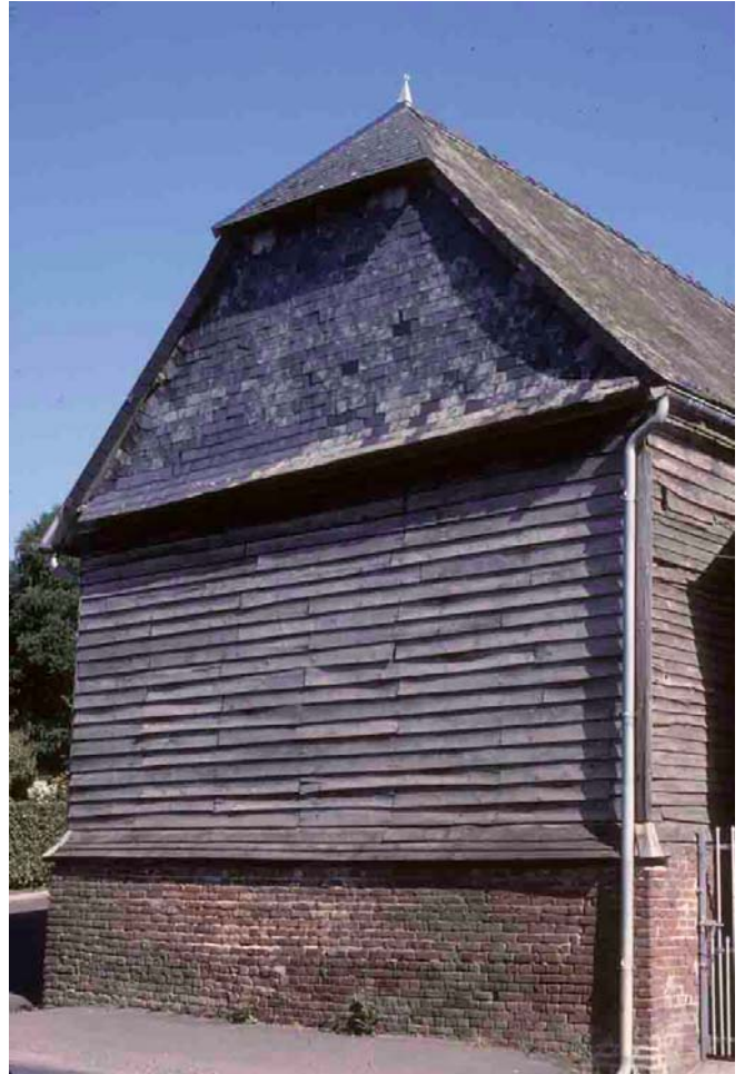
En Picardie, avec une demi-croupe formant visière, et des revêtements d'ardoise et de bois (le bauchage), formant becquets. Harcigny (Aisne), 1998.