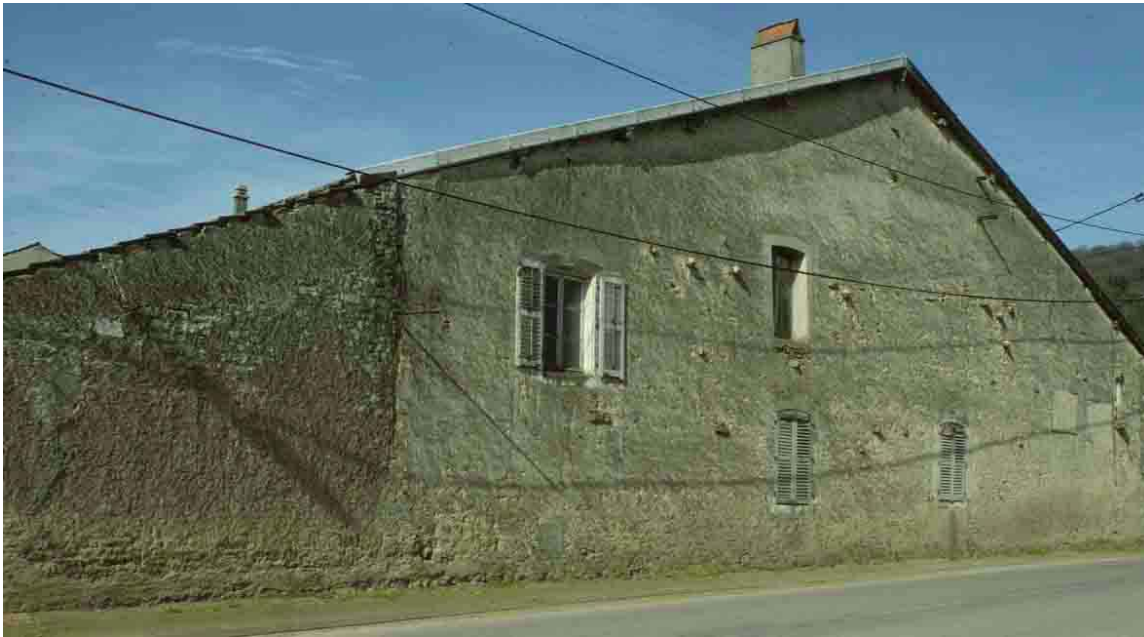
Barisey-la-Côte (Meurthe-et-Moselle), 1993, pignon non mitoyen, en extrémité de rue. Ce caractère non mitoyen lui permet d'être éclairé.

Normalement, les pignons sont plus étroits que les façades derrière lesquelles ils se cachent, ce qui traduit leur importance fonctionnelle et leur valeur de représentation moindre. Ils sont d'ailleurs généralement moins percés d'ouvertures et comme ils sont recouverts par le toit, leur hauteur ne les rend pas pour autant plus démonstratifs. Comme ils se présentent de côté, ils sont moins visibles. Il existe des cas d'exception, en Lorraine par exemple, où la profondeur des maisons rend les pignons plus longs que les façades, mais, comme les maisons sont mitoyennes, ces grands pignons ne se dévoilent pas, sauf en extrémité de rue.