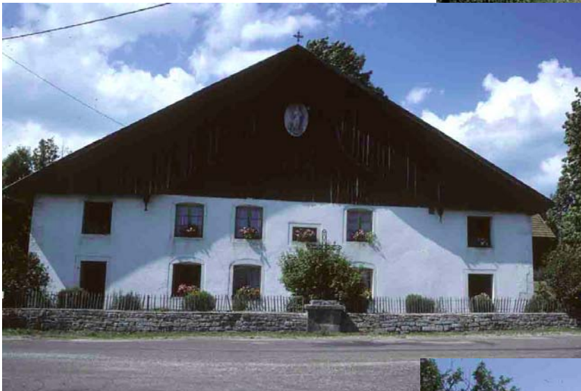
Le Béliou (Doubs), 1989, maison à pignon frontal du haut Doubs, à rang pendu en accolade. Il s’agit du triangle de pignon en bardage.