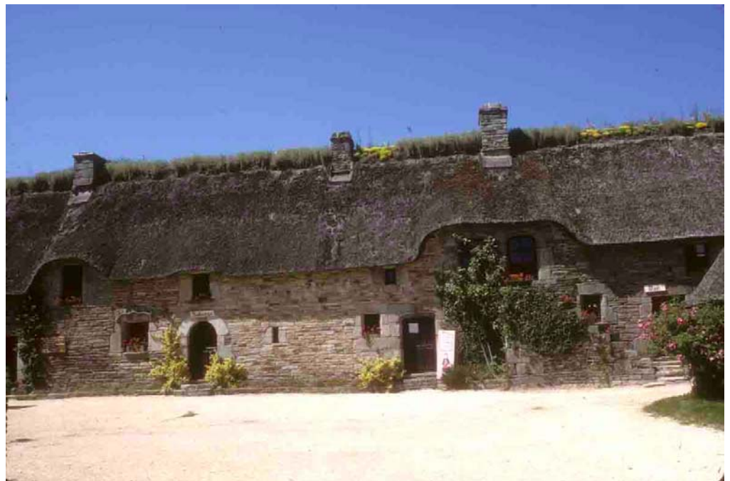
Poul-Fétan (Morbihan), 1998, la mise en place de la toiture dérobe le pignon aux regards.